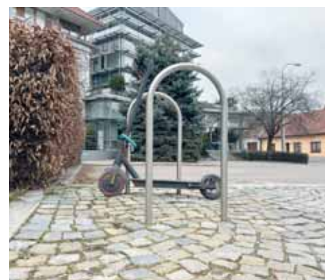
Cyklostojan před radnicí

Před několika lety byly na našem území instalovány nové cyklostojany v sedmi námi vytipovaných lokalitách (Údolí oddechu, Náměstí 28. dubna, před knihovnou a několik na přehradě). Naše Komise dopravní a bezpečnostní vybírala podněty od občanů a realizovány byly poměrně rychle.