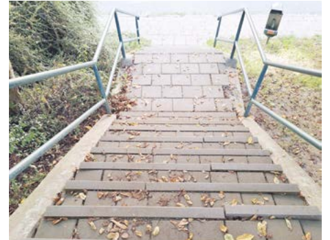
Třiramenné schodiště, Černého

Co se týče prodloužení tramvajového tělesa na Kamechy , začaly již přípravné práce související s kácením v koridoru a přeložkami sítí. Hlavní stavba začne až v roce 2026, a přestože městská část není investorem ani zadavatelem stavby, budeme se vždy snažit minimalizovat dopad stavby na občany. Informace průběžně aktualizujeme na webových stránkách měst-