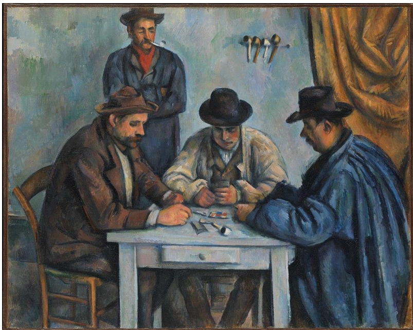
Obraz ze série Hráči karet, Paul Cézanne