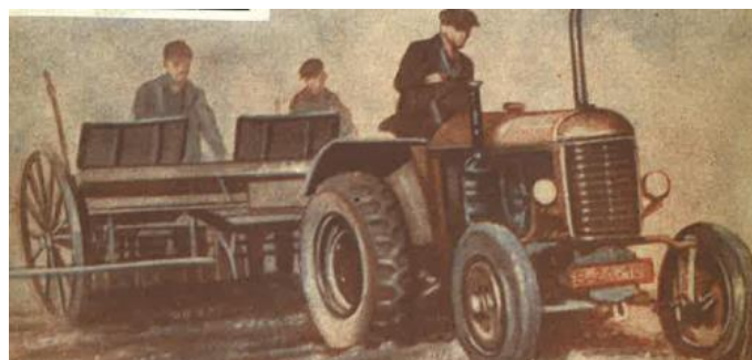
Traktor ŠKODA 30

Obrázek traktoru z publikace Obrábanie pôdy, vyd. Práca Bratislava 1950